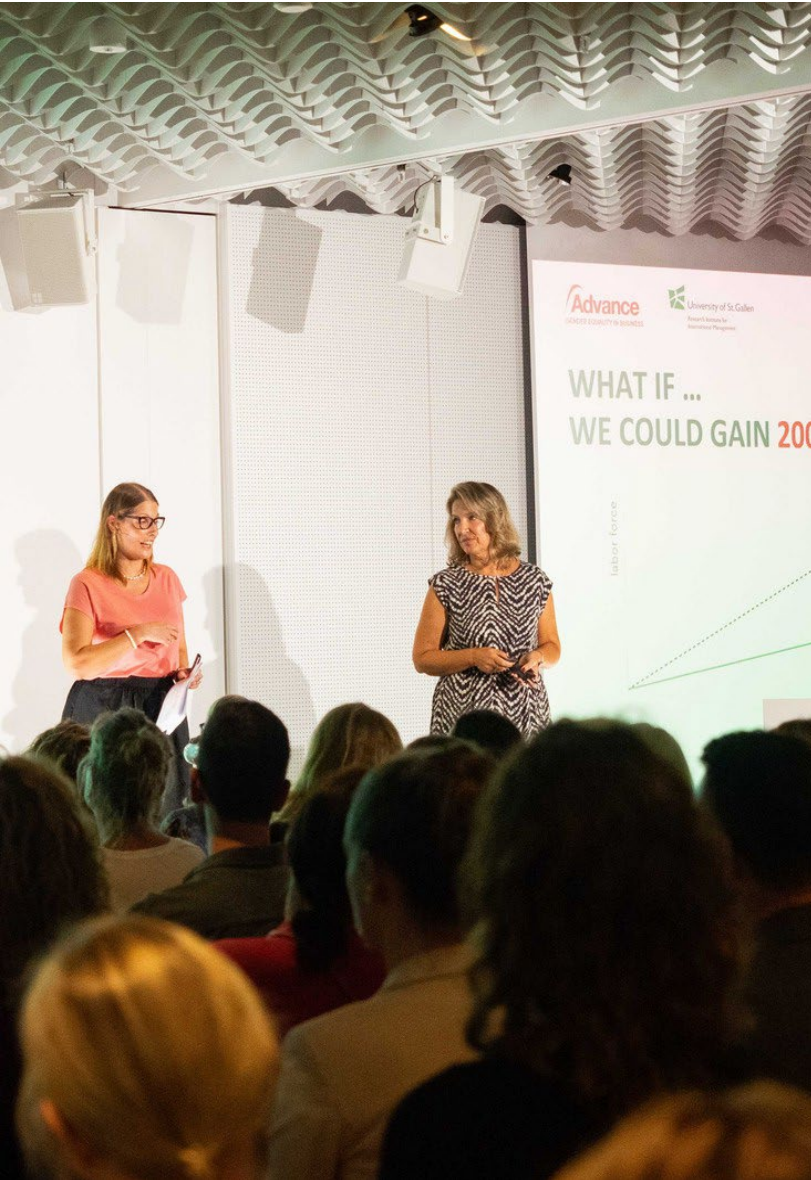
Gender Intelligence Report 2023

"[Mir gefiel] die Mischung aus theoretischen Elementen und praktischen Workshops. Die Tatsache, dass ihr aktives Networking ermöglicht und gefördert habt. Die kompetenten und charismatischen Referent:innen und die positive Atmosphäre, die ihr verbreitet habt."